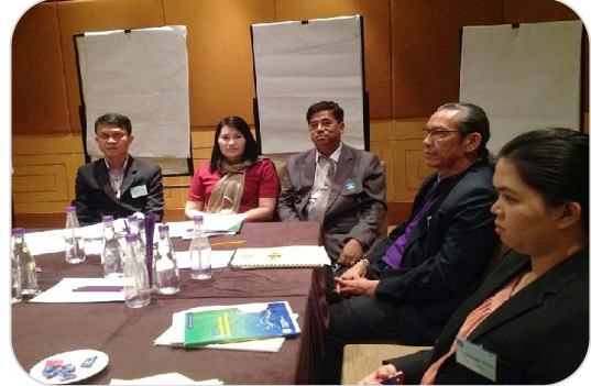
รองประธานฯ และผู้จัดการ เข้าร่วมการอบรมกับ สสอ. ที่โรงแรมมิราเคิล แกรนด์ คอนเวนชั่น กรุงเทพฯ