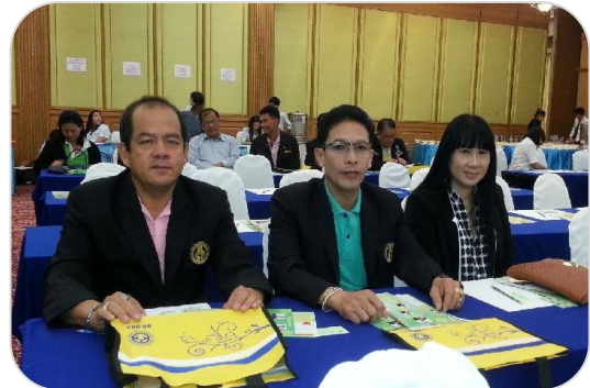
ประธานฯ เหรัญญิก และหัวหน้าฝ่ายทั่วไป เข้าร่วมสัมมนา กับ สส.สสอ. ที่จังหวัดนนทบุรี